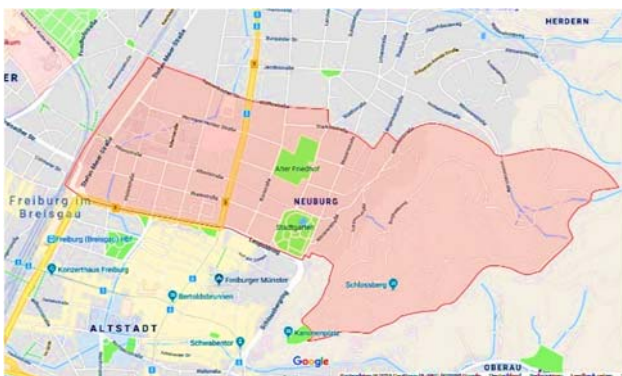
Der Freiburger Stadtteil Neuburg

Die heutigen offiziellen Grenzen des Stadtteils bilden: Die Eisenbahnlinie im Westen, Friedrich- und Leopoldring zur Innenstadt, der Schlossberg-Kamm im Osten sowie Starcken-, Weiherhof-, Wölflin- und Tennenbacher-Straße im Norden.