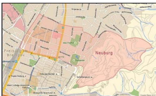
Stadtplan des Stadtteils Neuburg

Ein Blick in die Geschichte zeigt, dass die Neuburg einer der ältesten Stadtteile Freiburgs ist, dessen erste urkundliche Erwähnung als „nova civitas“ aus dem Jahr 1252 stammt. Er liegt nördlich der Freiburger Innenstadt und umfasste im Mittelalter das Gebiet zwischen dem heutigen Stadtgarten, der Johanniterstraße und der Katharinenstraße. 1679 wurde die Neuburg im Zuge des Vauban'schen Festungsbaus weitgehend zerstört. Danach wurde mehrfach versucht, den Stadtteil wieder aufzubauen. Aber erst gegen Ende des 19. Jahrhunderts, vor allem in der Amtszeit von Oberbürgermeister Winterer, gelang dies wirklich. In dieser Zeit wuchsen die beide Stadtteile Neuburg und das sich ebenfalls ausdehnende, benachbarte Herdern zusammen. 1944 wurden durch den Bombenangriff auf Freiburg auch einige Teile der Neuburg zerstört und nach dem Krieg neu aufgebaut; so vor allem das Institutsviertel der Universität. Die Neuburg besteht heute aus verschiedenen Quartieren, von den Villen am Schlossberg bis zu den Wohnhäusern im Institutsviertel. Außerdem enthält sie viele Büros, einen großen Teil der Universität, das Gefängnis, das Josephi-Krankenhaus, mehrere Altenheime, Sporthallen, Schulen und Neubaugebiete wie den Keplerpark.