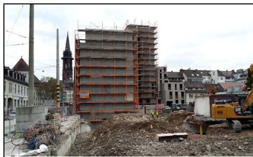
Abrisse und Neubauten in der Habsburgerstraße

Die Ziele sind dabei: Das Bewusstsein zu stärken, dass es einen eigenständigen Stadtteil Neuburg in Freiburg gibt. Es soll deutlich gemacht werden, was diesen Stadtteil prägt und was er an städtischem, wirtschaftlichem und kulturellem Leben zu bieten hat. Das Zusammengehörigkeitsgefühl seiner Bewohner soll gestärkt und die Veränderungen des Stadtbildes sollen kritisch begleitet werden. Das betrifft vor allem die zunehmende Straßenverkehrsbelastung sowie die zahlreichen laufenden und anstehenden Bauvorhaben.